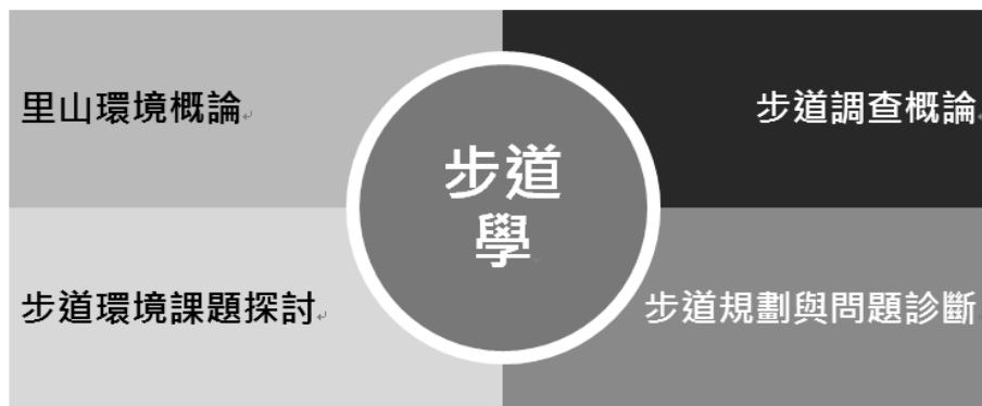
圖三：民間步道學入門、實務課程架構

步道的養護、清查甚至規劃，都需要更多公民參與，以公私協力的模式重新建構人與自然生態的平衡，這套環境教育主題課程，規劃經過 4 個月的密集培訓，有 24 位完成入門與實務課程的培力志工，成為未來環境守護的行動力量。