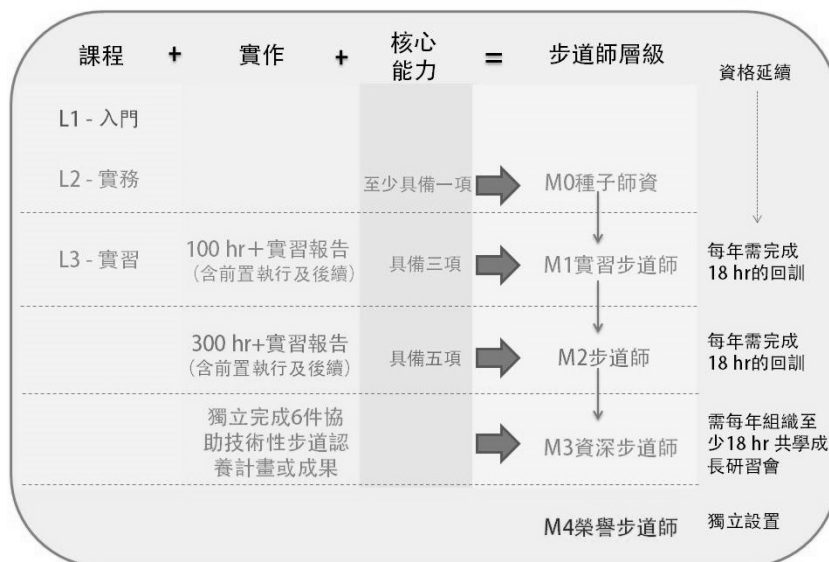
圖四：步道師培訓認證層級示意圖

榮譽步道師則為獨立設置，指傳承族群對手作步道傳統之工法、智慧、文化價值與技藝，著有績效貢獻者，可以作為舉薦之優良表現參考，以示尊崇。例如，在屏東的舊達來部落，現已 80 多歲高齡的排灣族老師傅擁有當地石板砌石的傳統工法技術，值得給予榮譽步道師之肯定，且極具有積極紀錄保存下來的價值。